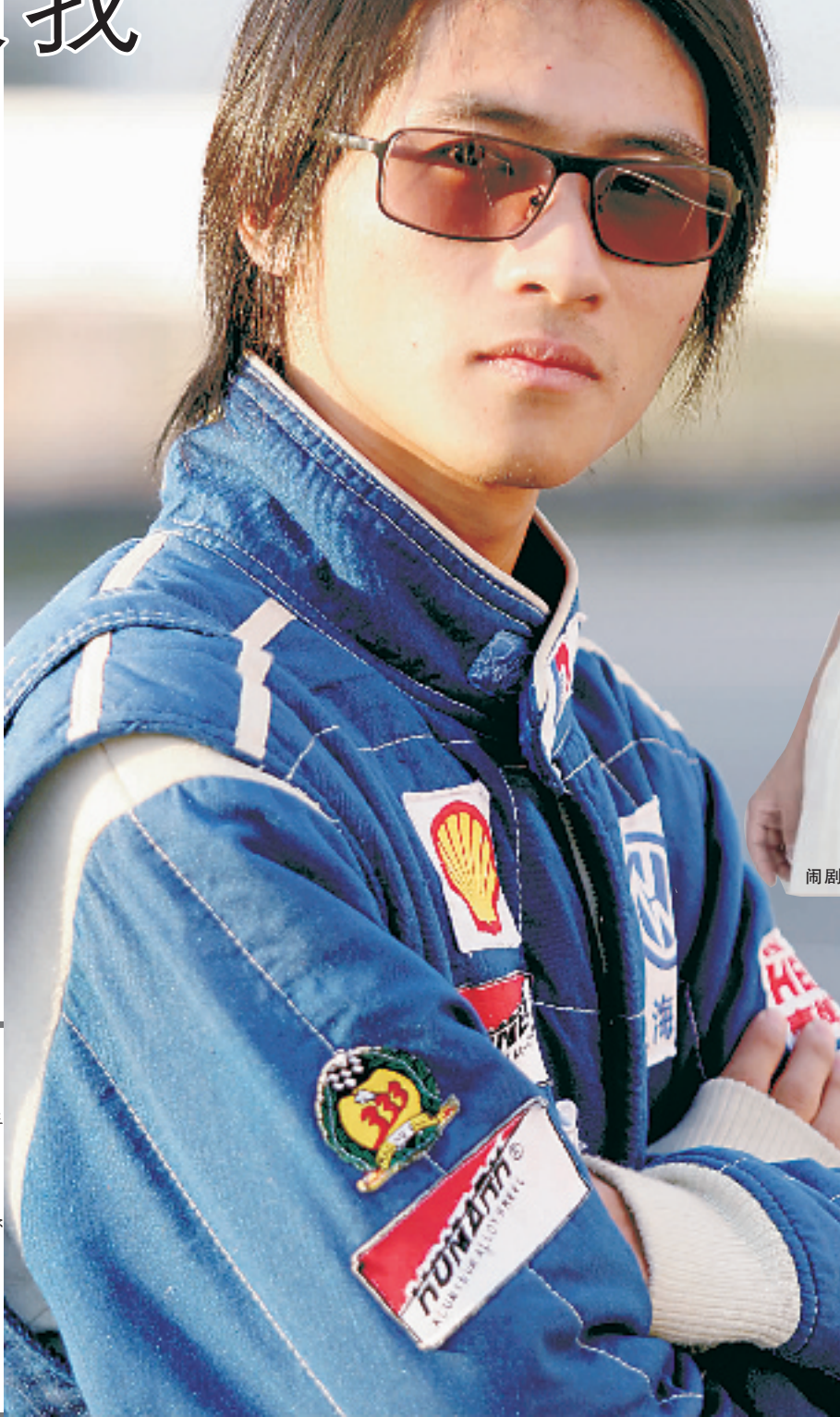
闹剧中吃了哑巴亏的韩寒