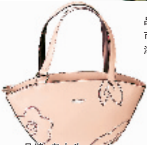
品牌:老人头 市场价:498元 淘宝价:298.8元