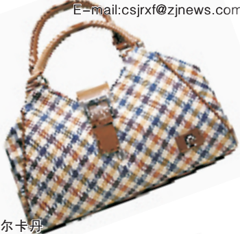
品牌:皮尔卡丹 市场价:609元 淘宝价:200元