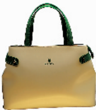
品牌:花花公子 市场价:628元 淘宝价:376.8元