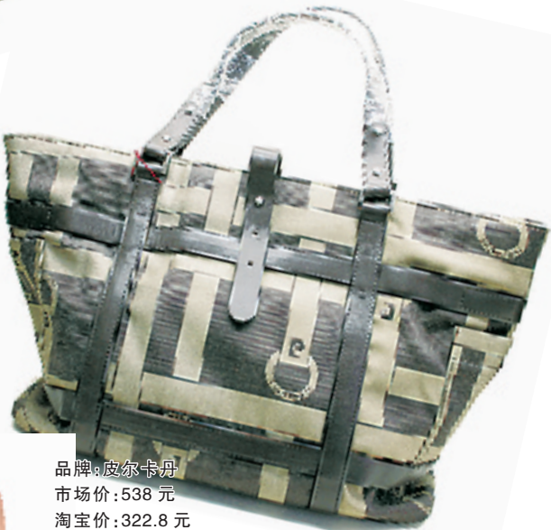
品牌:皮尔卡丹 市场价:538元 淘宝价:322.8元