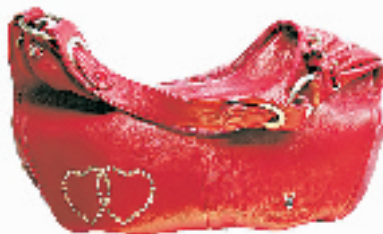
品牌:花花公子 市场价:998元 淘宝价:450元