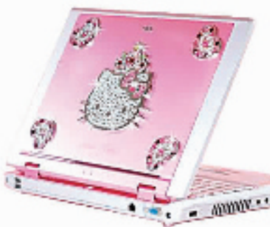
★NEC-Hello Kitty 笔记本