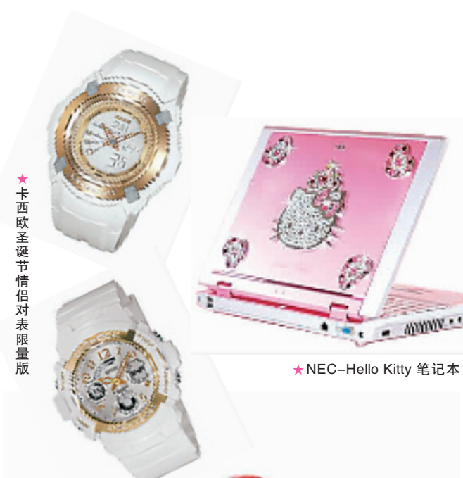
★卡西欧圣诞节情侣对表限量版

在特力屋,除了拥有所有能烘托圣诞气氛的东西之外,我们还看到了几款相当智能的家居用品,比如一款名为福玛特机器人的保洁器,能够自动扫地自动充电,并独立完成 120 多平米房间的清洁工作;另外,我们还发现了一些很有意思的家居小品,诸如日本进口的“爷爷奶奶、爸爸妈妈、孩子”系列茶具、带有漂亮包装的马克杯、可以伸缩的便携式笔筒不锈钢筷子、酒类礼盒套装……相信你去转了一圈后,整个冬天的圣诞礼物就不必愁啦。如果带上它们去作客,说不定还能得到主人一个大大的拥抱哦!