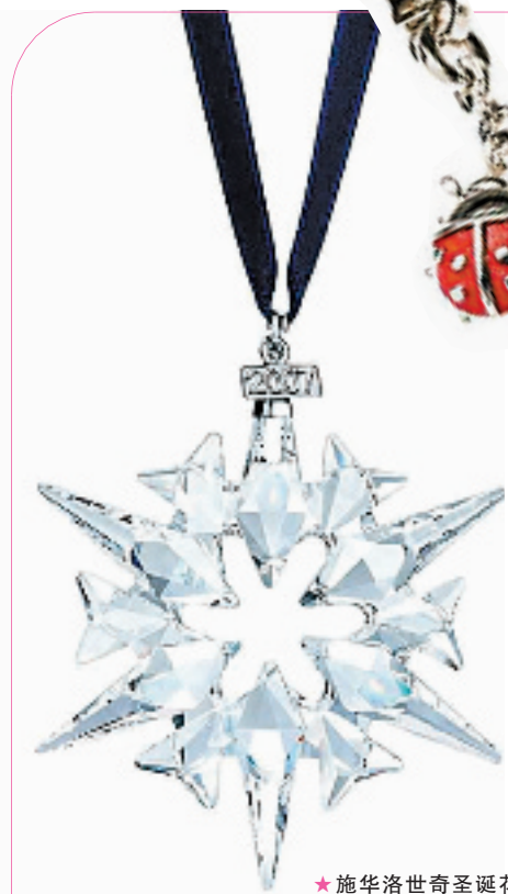
★施华洛世奇圣诞花

而卡西欧 2007 年圣诞节情侣对表限量版,特意在表面和指针等重要位置运用金属元素,表面箭形指针和心形表盘,设计来源于爱神丘比特的神话,背刻是天使与魔鬼的图案以及“2007”字样,每一个细节都为今年的圣诞节带来无限惊喜。