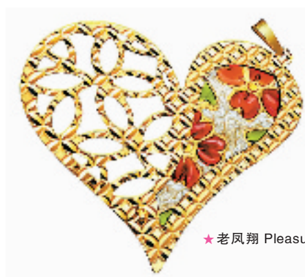
★老凤翔 Pleasure 挂件

圣诞节意味着什么呢?天上飘着洁白的雪花,挂满彩灯和玩具的圣诞树,温暖的灯光和香气扑鼻的晚餐,红色外套下笑容可掬的圣诞老人,和最亲爱的人手牵手在圣诞音乐声中漫步铺满雪的街头……其实,圣诞就是这样的一个节日,可以给人带来莫名的快乐气氛,让人感觉到温暖和幸福,或许是因为那些精致的礼物,或许是因为那温馨的气氛,或许是因为可爱的圣诞老人和美丽的传说……总之,让我们一起来享受这个可爱浪漫的节日吧。