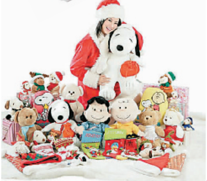
★圣诞 Snoopy 系列