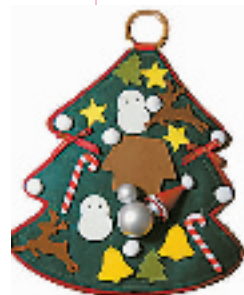
★Iriver Disney Mplayer