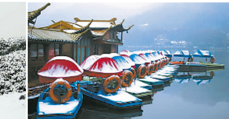
白堤上的游船码头

“踏雪寻梅”或许说的正是灵峰,鲜艳的梅花挂在雪枝之下,那种色彩的搭配非常完美。很多摄影师只要一看到这画面,都会忍不住按快门。