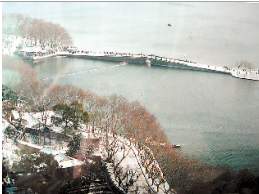
1985年的断桥雪景全图