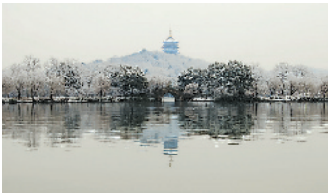
从花港公园长廊拍雷峰塔雪景,把塔的倒影安排在桥洞中间,比较好看。