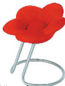
这样的情侣座椅一定能打动不少女孩子的心