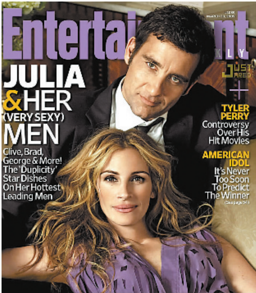
茱莉亚·罗伯茨与克里斯·欧文登上最新一期《娱乐周刊》封面。他们合作的新电影《口是心非》于20号在美国等地上映。在片中，她与克里夫·欧文饰演一对“间谍情侣”。