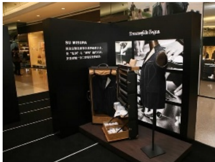
杰尼亚的量身定制区