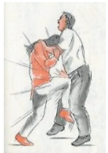
遇到坏人,MM 可以这样做