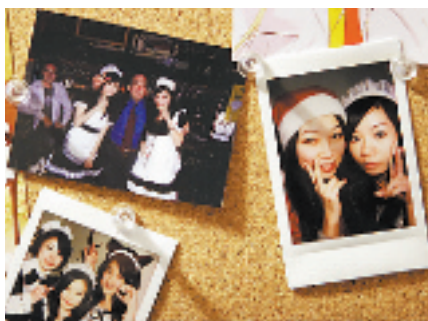
墙壁上是客人留下的照片