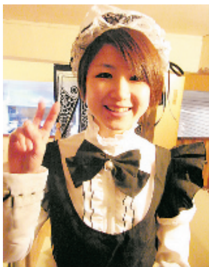
大多数“女仆”是大学生