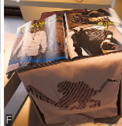
A YOHO 年轻老板娘推荐绿色潮 T B、C 充满中国民族元素的雷朋款眼镜及眼镜盒 D YOHO 店一角，鸭舌帽及眼镜 E YOHO 店一楼 F YOHO 杂志