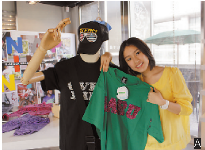
上接 A07 版