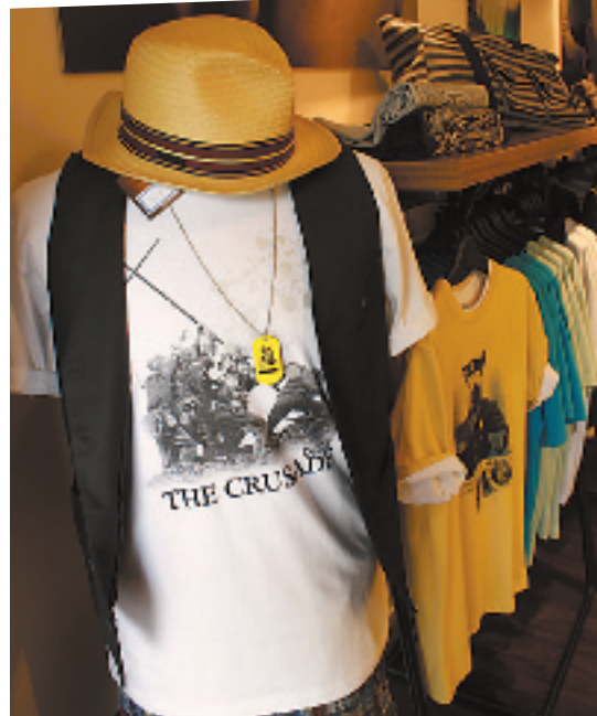
G DUSTY 店帅小弟 H 店门非常有日本潮店的感觉 I 店面陈列，里面有很多适合潮女的衣服 J 店里的一套衣服，搭配得潮味十足