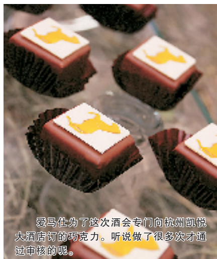
爱马仕为了这次酒会专门向杭州凯悦大酒店订的巧克力。听说做了很多次才通过审核的呢。

店内装饰材料的选取致力体现专卖店柔和、精致和简洁的风格。家具和墙板采用欧洲野樱桃木,墙上意大利大理石的饰面。由于后外立面是一面巨大的玻璃凸窗,所以整个专卖店内都有大量自然采光。天花板照明灯以回纹饰排列,更加彰显出品牌的风格。每一格陈列架都有灯光照明,另外还有几组嵌入式定向射灯,对不同产品展区作出明确划分。