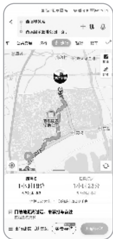
百度地图App步行导航主界面。