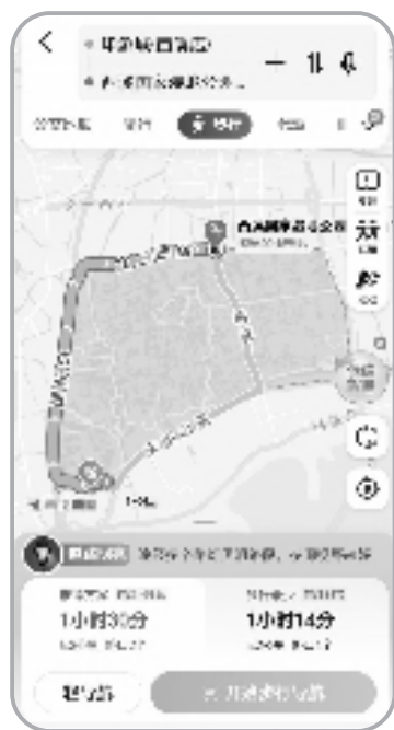
高德地图App步行导航主界面。

下面,我们以高德地图和百度地图App为例,学一学如何通过地图软件的步行导航功能,快速精准地抵达目的地。