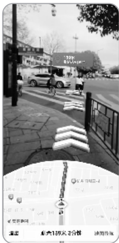
高德地图AR步行导航模式下,蓝色方框表示当前方向需要继续行走的距离,蓝色箭头表示前进方向。