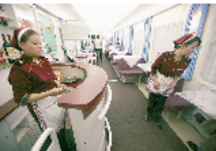
7 月 1 日首发列车上的服务员

第二天在布达拉宫,又碰上许多火车上一起来的旅客。见了面,点头含笑,也算得上是一段旅途的缘分。