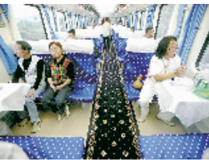
图为 7 月 1 日列车的硬座留有许多空位。许多乘客买了票并没有上车,买火车票只是为留念。